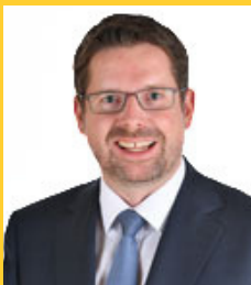
Stracke, Stephan (CSU)