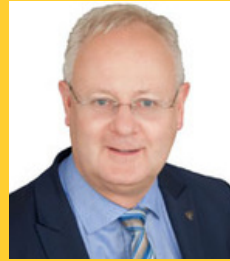
3. Bürgermeister Pohl, Bernhard (Freie Wähler)